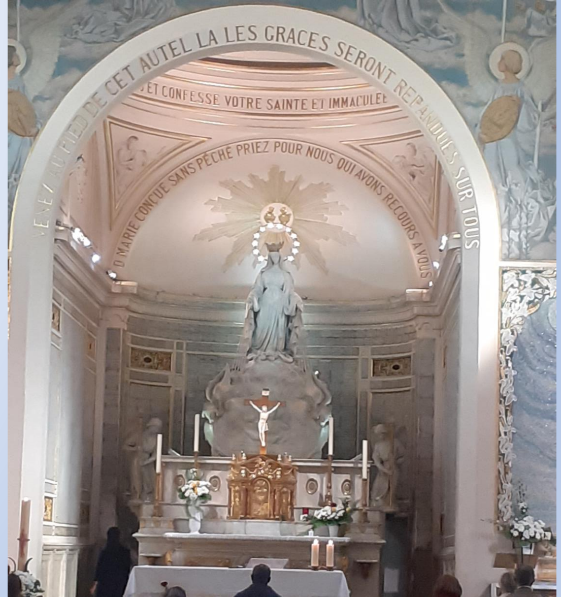
Rue du Bac Chapelle Notre Dame de la médaille miraculeuse