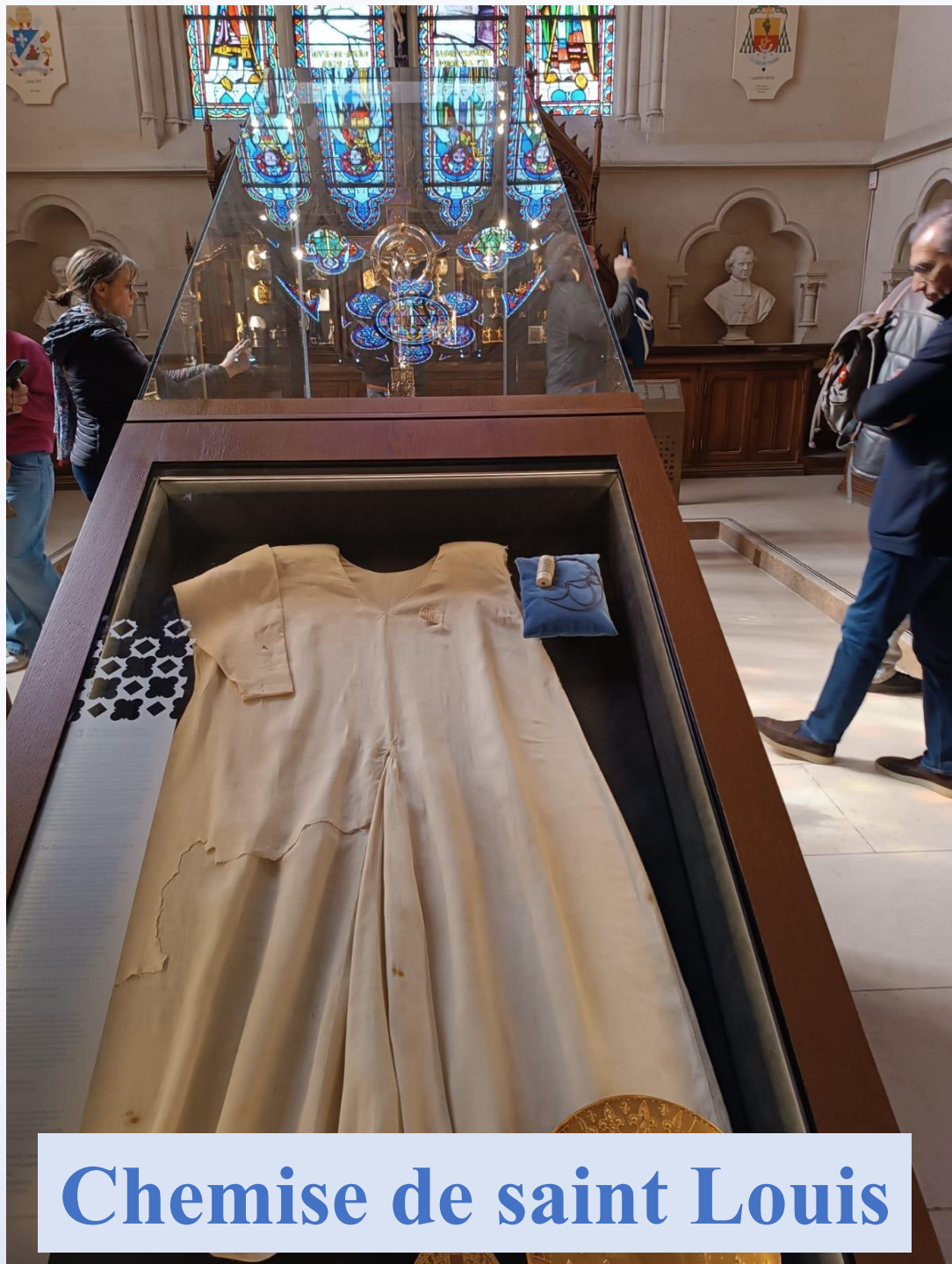
Chemise de saint Louis