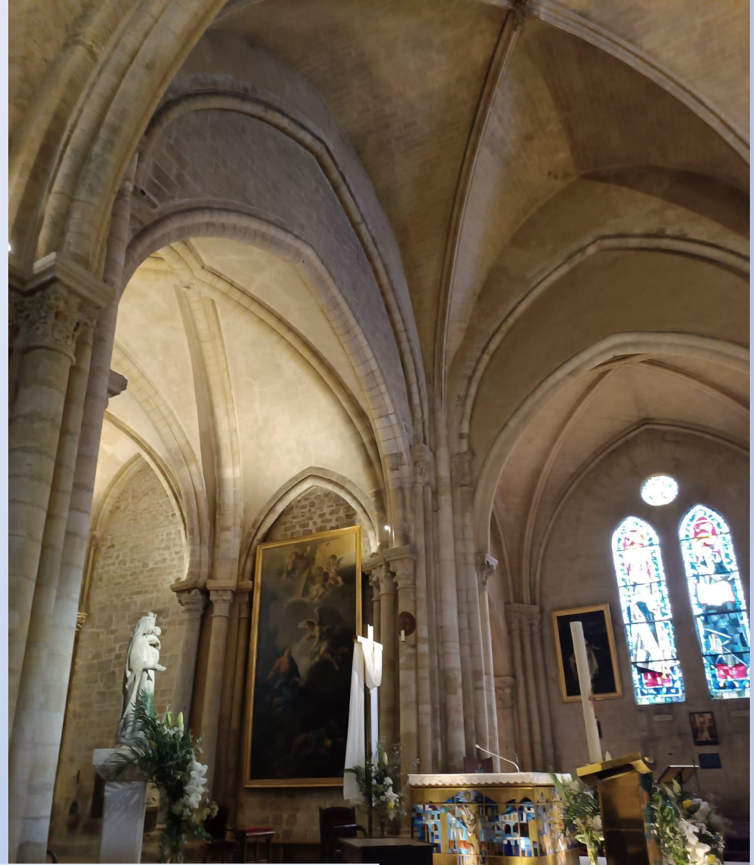
Eglise Saint Pierre de Montmartre