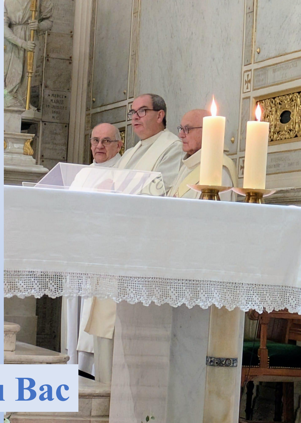
Messe Rue du Bac