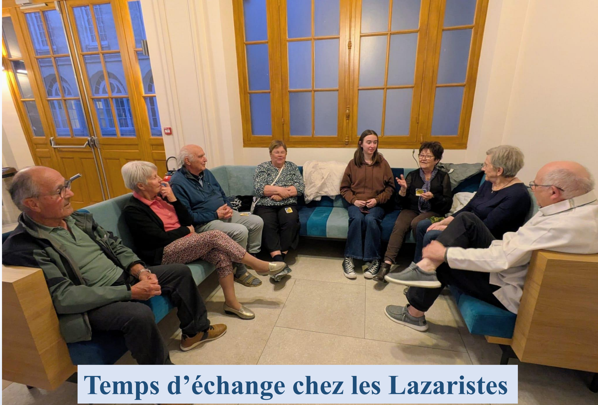
Temps d'échange chez les Lazaristes