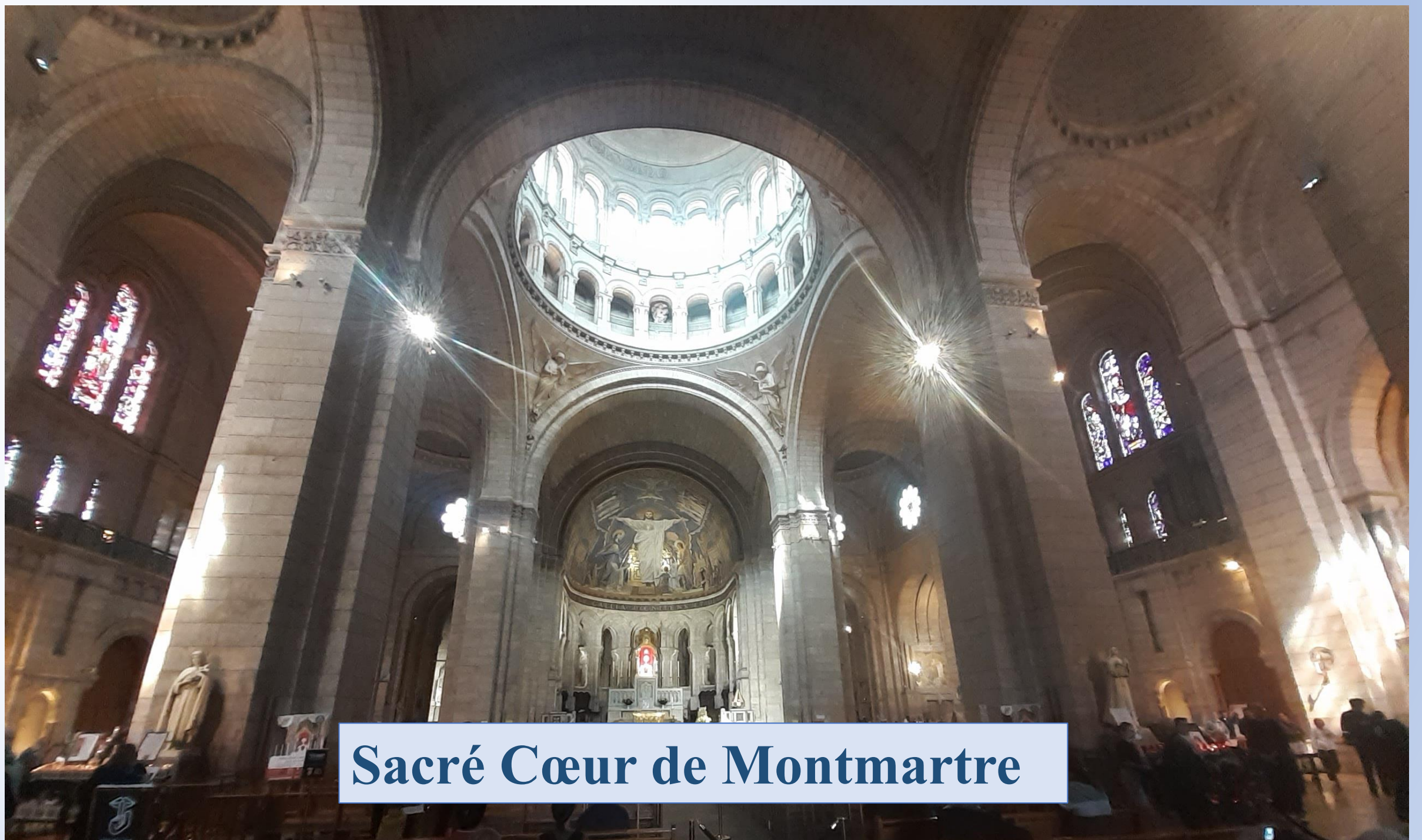
Sacré Cœur de Montmartre