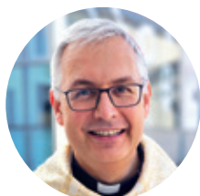
Mgr François Durand, évêque de Valence.

À l'occasion de la Saint-Apollinaire, fête du diocèse de Valence, Mgr François Durand a publié sa première lettre pastorale 2025-2028, « Tous baptisés dans un unique Esprit. »