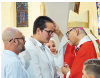
Un fidèle reçoit la confirmation de Mgr François Durand.

pare à la confirmation dans notre paroisse. Inscrivez-vous auprès du curé, 04 75 43 21 80. Pas de limite d'âge !