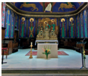
Chœur de l'église Saint-Pierre.